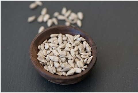
Sonnenblumenkerne 2/3 oz (19g)

1. Das Rezept enthält keine Zubereitungsschritte.